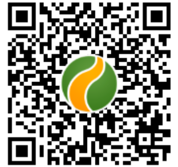
QR code del Sentiero dell'Ariosto